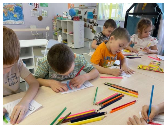
*Занятие «Какого цвета эмоция?» в подготовительной группе «Туристы»